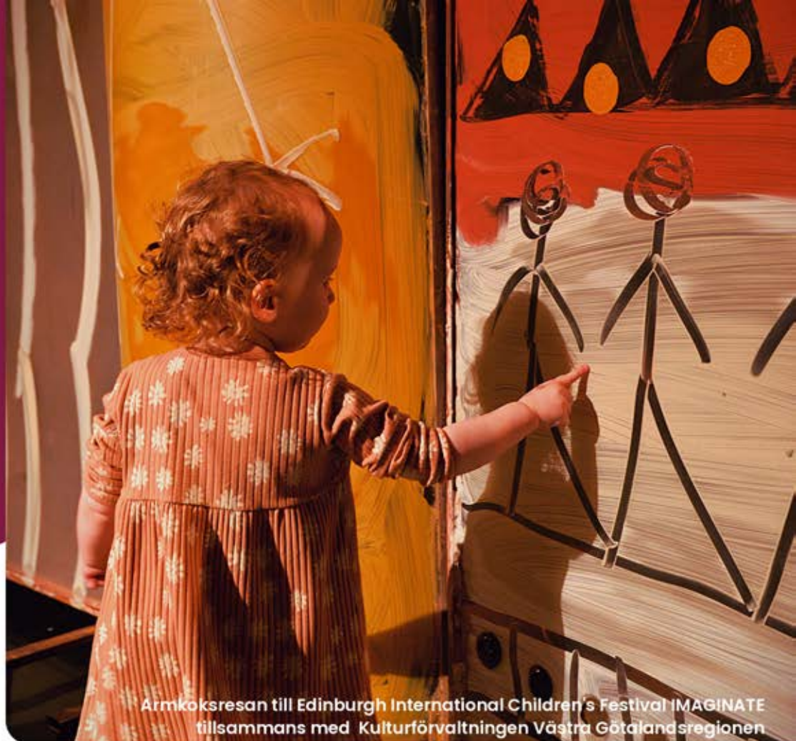
Armköksresan till Edinburgh International Children's Festival IMAGINATE tillsammans med Kulturförvaltningen Västra Götalandsregionen