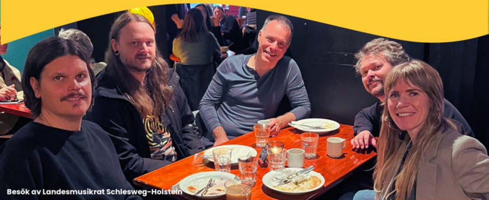
Besök av Landesmusikrat Schlesweg-Holstein

I slutet av november fick MCV och Kulturförvaltningen besök av Landesmusikrat Schlesweg-Holstein (Kiel, Tyskland); en paraplyorganisation som samlar fler än 60 olika medlemsorganisationer och initiativ i den nordtyska regionen. Besöket föranleddes av ett inledande möte under Reeperbahn-festivalen och som nu kunde docka an till den göteborgska klubbfestivalen och mötesplatsen Viva Sounds där även MCV deltog genom LMFS. Projektmedel från ExpoReady möjliggjorde för MCV att bjuda medlemsakter som var intresserade av festivalen. MCV avser att söka ytterligare projektmedel för 2026 för att utveckla våra påbörjade samarbeten.