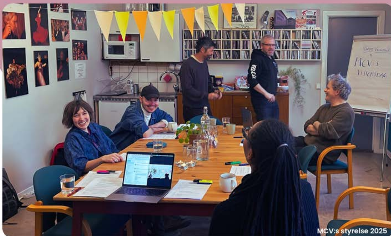
MCV:s styrelse 2025